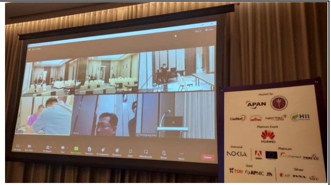
ทุกห้องพร้อม