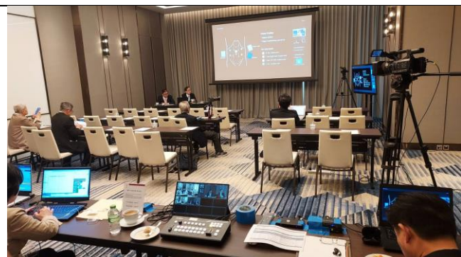
ห้องทงหล่อเริ่มงาน MIS session