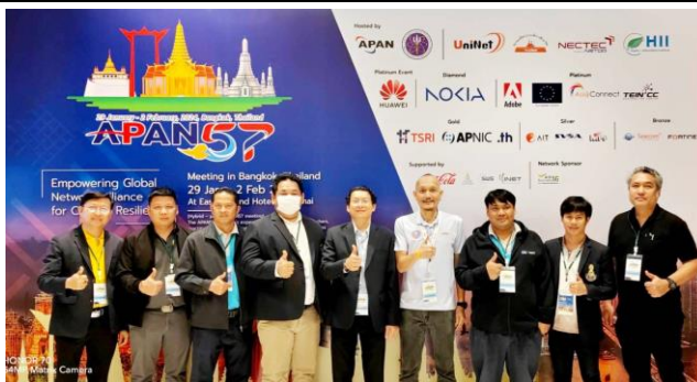
ทีมงานชั้นนำ