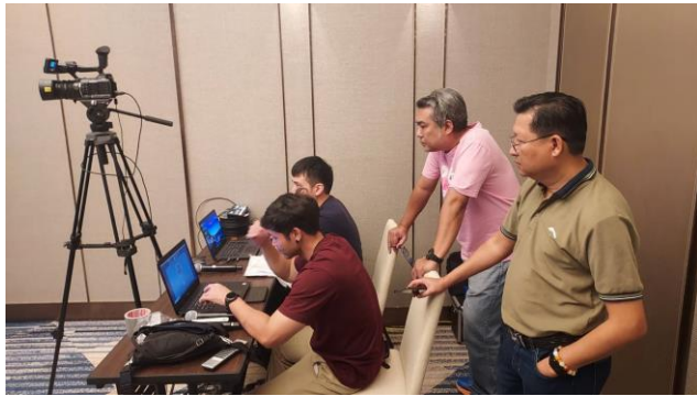
ห้องจัดลมกำลังเตรียมระบบภาพและเสียง