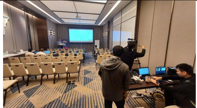
ห้องจัดลมเริ่มงาน