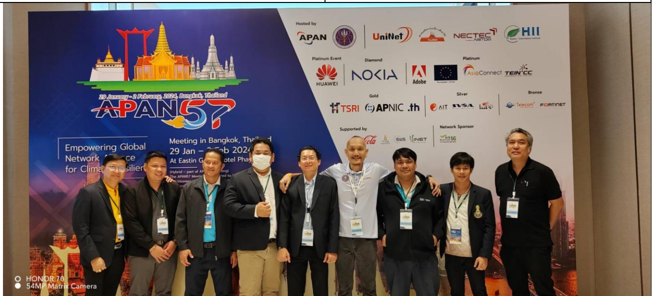
ขอบคุณทุกท่านครับ