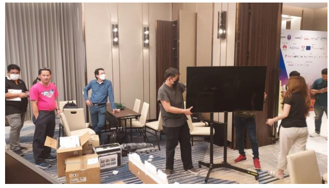
ห้องทงหล่อกำลังติดตั้งระบบภาพและเสียง