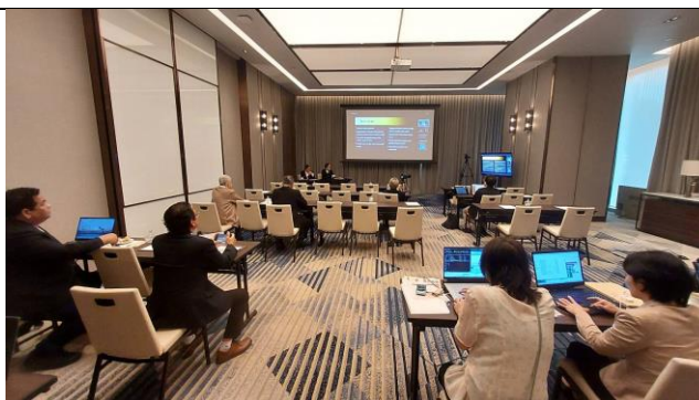
ห้องทงหล่อเริ่มงาน MIS session