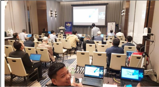
ห้องเพนจินิจตเริ่มงานเหมือนกัน